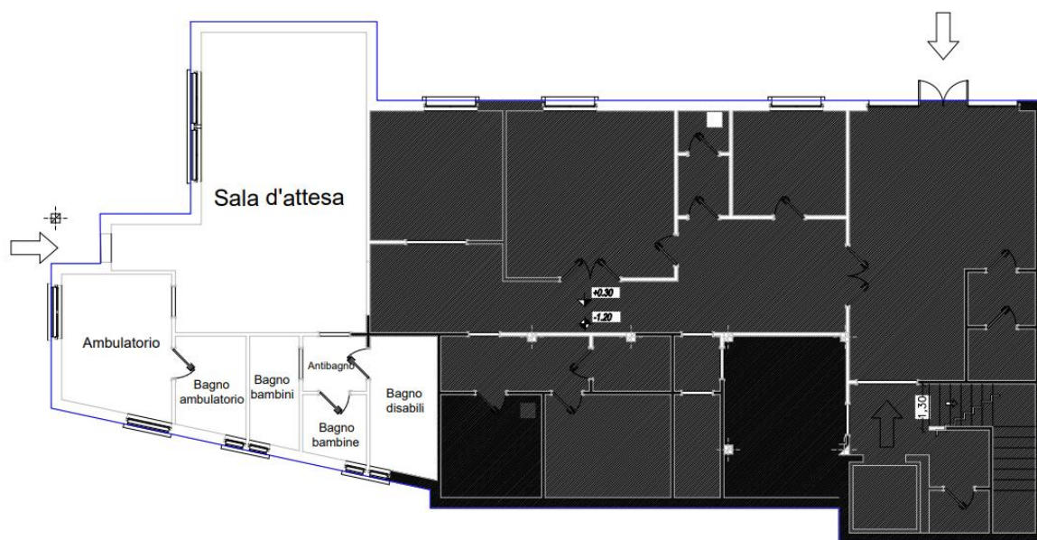
Planimetria 2 – Pediatria